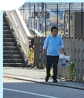
中村区 近鉄黄金駅