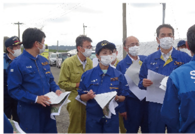
台風14号被災現場(宮崎県)視察