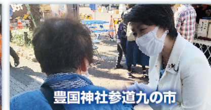
豊国神社参道九の市