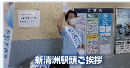
新清洲駅頭ご挨拶