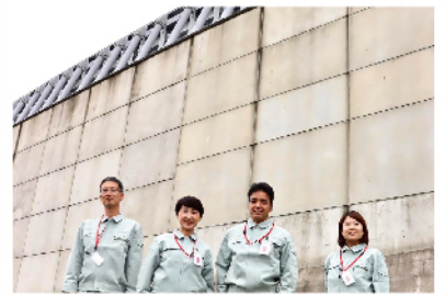
約1.6kmに及ぶ「防波壁」の前で