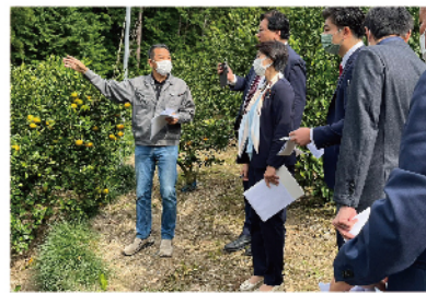
台風15号被災農地(静岡市)視察