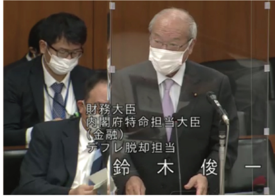
財務大臣 内閣府特命担当大臣 (金融) デジタル脱却担当 鈴木 俊一

今国会から所属した財務金融委員会で、初質問に立ちました。ここ30年賃金が上がらない状況を踏まえ、「賃上げ促進税制」を取り上げ、なぜ賃金があがらないのか、持続的な賃上げの実現にはどうすべきかを鈴木財務大臣に問いました。