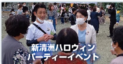
新清洲ハロウィン パーティーイベント