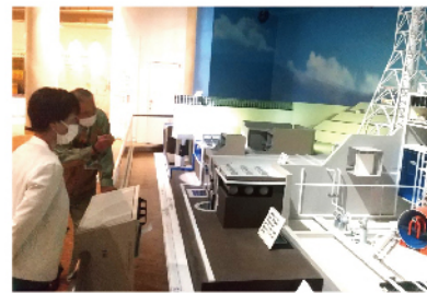
原子力発電の仕組みについて説明を受ける