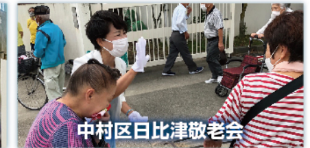
中村区日比津敬老会