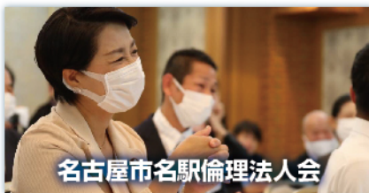
名古屋市名駅倫理法人会