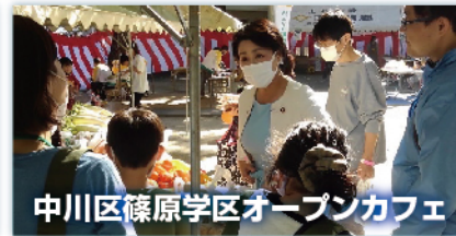
中川区篠原学区オープンカフェ