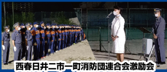
西春日井二市一町消防団連合会激励会