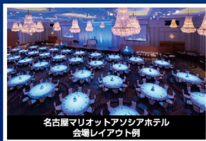
名古屋マリOTTアソシアホテル 会場レイアウト例