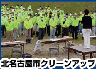
北名古屋市クリーンアップ