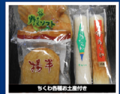
ちくわ各種お土産付き